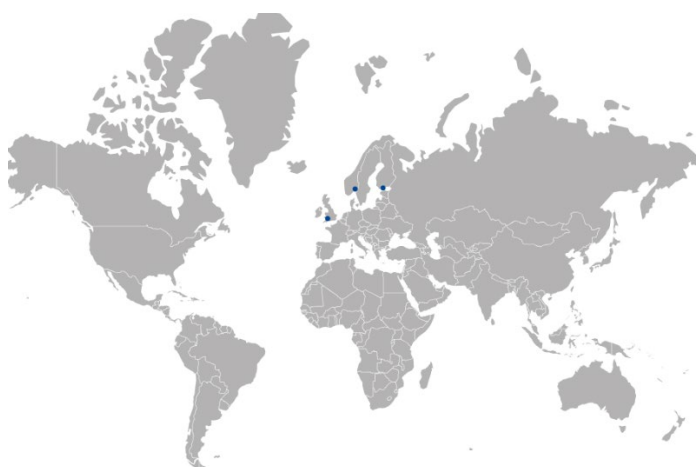
Bild: Aktiva avtal arbetsterapeutprogrammet 2023-12-13

De internationella avtalen inom arbetsterapeutprogrammet är sammankopplade med kartan som du ser nedan. Klicka på kartan för att komma till en översikt över våra nuvarande samarbetspartners med detaljerad information under respektive land/universitet. Kartan uppdateras löpande under året inför att ansökan öppnar. Kartan är kopplad till ansökningsformuläret och du hittar samma lärosäten där. Under perioden 1 september – 1 oktober (deadline) samt 10 jan – 1 februari (deadline) ska samtliga avtal vara uppdaterade och platserna sökbara för studenterna. Det finns 2-3 platser per avtal. Du söker terminen innan avresa dvs. 1 feb för utresa till hösten och 1 oktober för utresa våren.